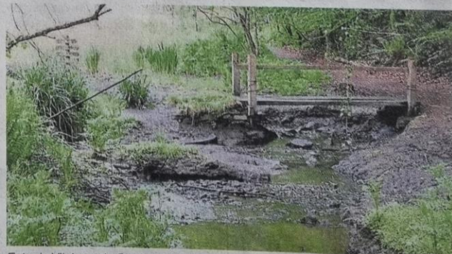
Entre la Vilaine et la Chevré, et à deux pas de la forêt de Liffré, les randonneurs découvrent de magnifiques paysages.