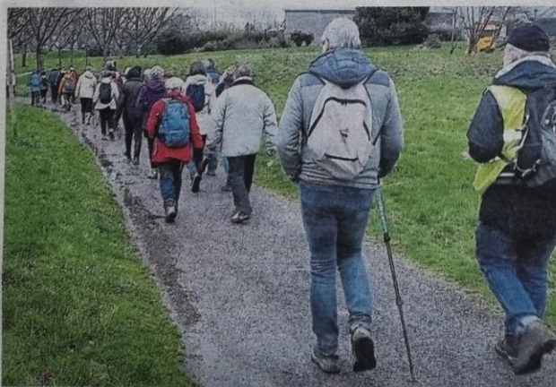
La commune compte quatre circuits de randonnées. « Mais il y a tellement de variantes, que l'on peut toujours trouver un circuit inédit. »